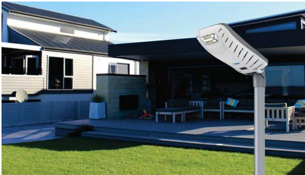
Version musicale Bluetooth LSPX3S01 à installer sur mat fixe ou sur support mural