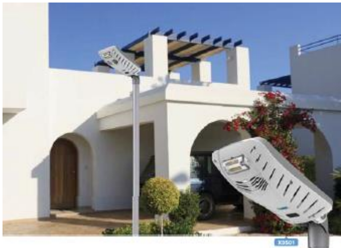
Version musicale Bluetooth LSPX3S01