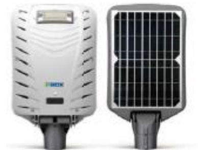
Version Lumiere seule LSPX3 avec capteur a installer sur mat fixe ou support mural.